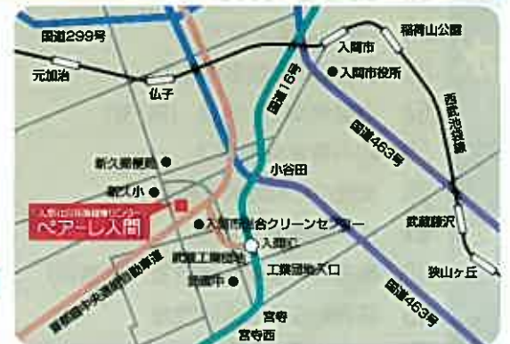
●交通 西武池袋線入間市駅よりバス12分、ペアーレ入間入口下車、徒歩10分

ペアーレ(Peare)とは、フランス語のprogrès(進歩、発達)、éducation(文化、教養)、athlétisme(運動、競技)、repos(休憩、寛ぎ)の頭文字を組み合わせたものです。